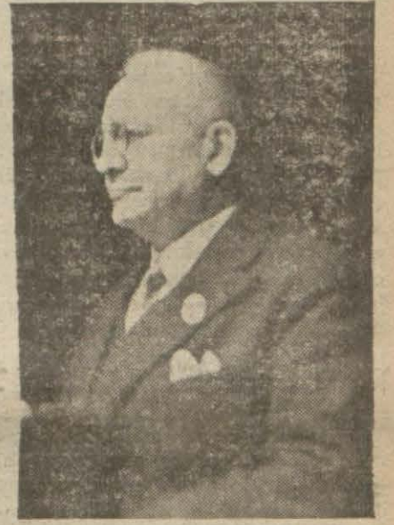
Şihhiye Vekili Hulûsi Alataş

3 — Bu işe mütecasir oldukları gene cemiyetin kendi kontrolü neti- cesinde meydana çıkan merkezi u- mumî vezne kâtibi Sami ile muhase- be kâtiblerinden Şemseddin cemiyet idare heyetinin talebi üzerine müd-