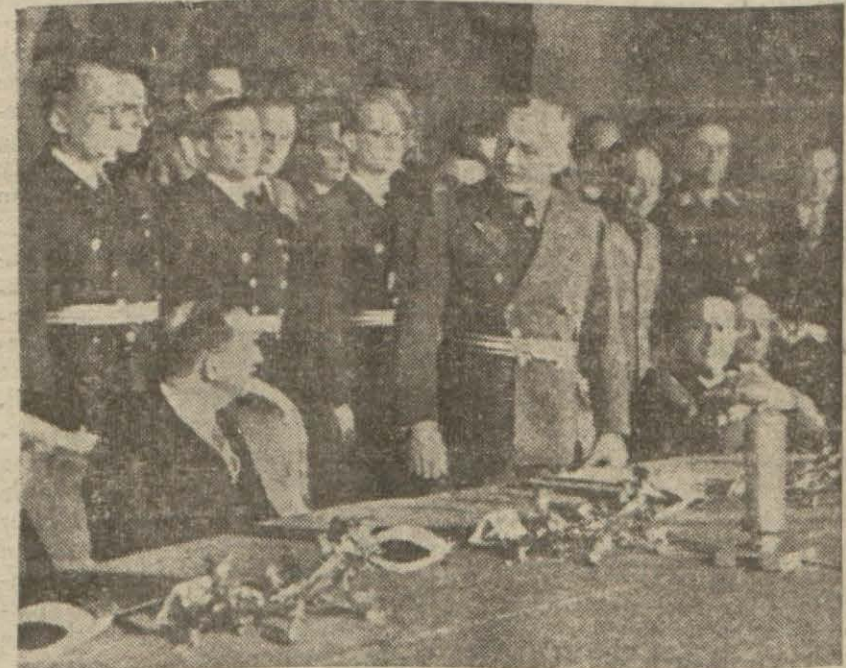
Bulgaristanın üçlü pakta iltihakı merasimine aid bir intiba

vermiştir. Bu karar üzerine, Zeki Ri- za medenî kanunun kendisine ver- diği hakkı sital ve mahkemeye müracaat ederek, salâhiyettar ol- mayan bir heyetten sadır olan bu (Devamı 7 nci sayfada)